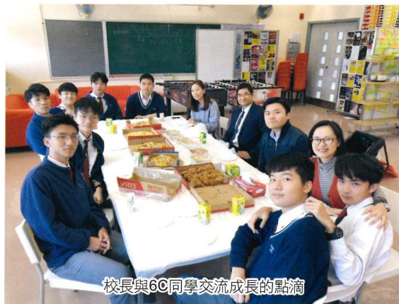
校長與6C同學交流成長的點滴