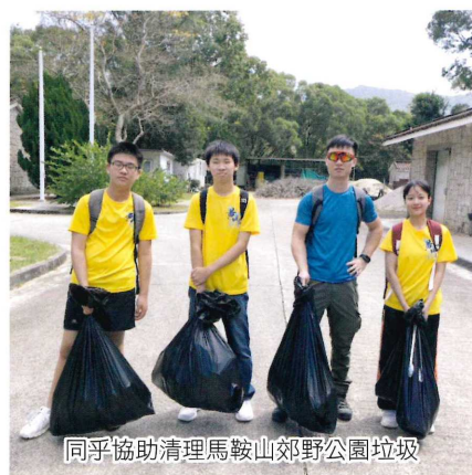
同學協助清理馬鞍山郊野公園垃圾