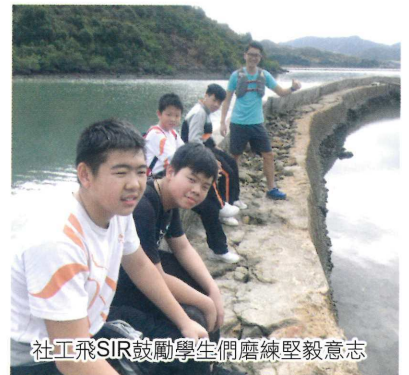
社工飛SIR鼓勵學生們磨練堅毅意志