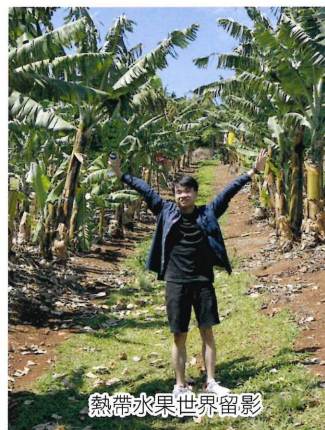
熱帶水果世界留影