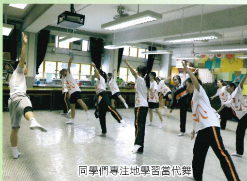
同學們專注地學習當代舞

在短短五堂課的當代舞工作坊中，同學們獲益良多。而當中最優秀的三位學員更會獲邀參加2020年1月至2月期間的當代舞深造工作坊，與另外四間中學學員交流切磋，並於2020年2月15日於香港藝術節期間假牛棚藝術村作公開表演，與社區及公眾人士分享學習成果，期待她們精湛的演出。