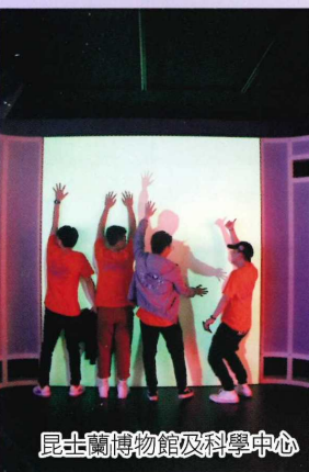
昆士蘭博物館及科學中心