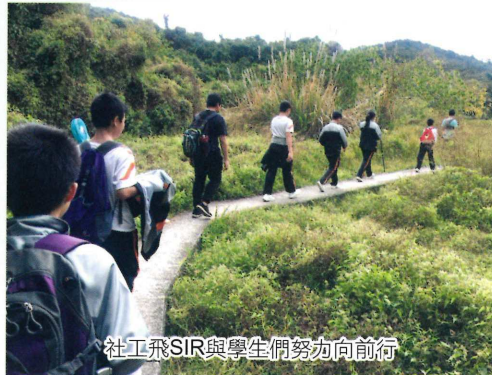
社工飛SIR與學生們努力向前行