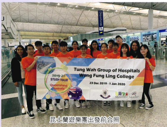
昆士蘭遊學團出發前合照