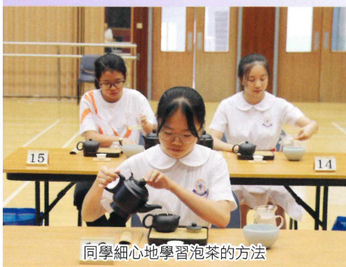
同學細心地學習泡茶的方法

全校中一至中六級二十五位茶藝班學員在年終經考核通過，由徐仲坤署任校長頒發基本泡茶考試合格証書，同學的學習成果得到肯定，提升校園文藝氛圍有正面的幫助。