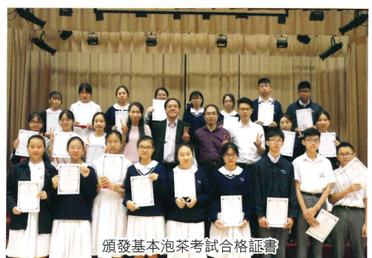
頒發基本泡茶考試合格証書