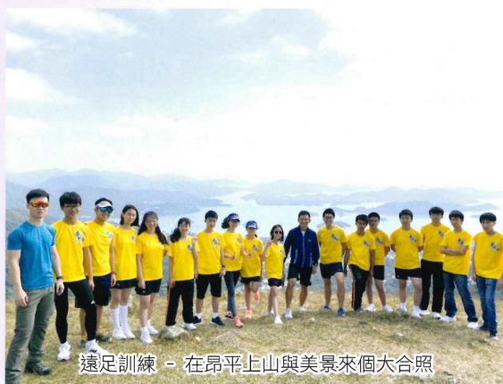
遠足訓練 - 在昂平上山與美景來個大合照

秋高氣爽的天氣，就是跑步的好日子。本組安排同學到馬鞍山的昂平平原，進行遠足訓練。經過一段蜿蜒的山徑後，同學們到達終點時，紛紛舉起手機，記錄了當前壯闊的大自然美景。在回程時，同學們更清理其他行山人士遺留下來垃圾和雜物，愛惜大自然美景，過程中讓同學們學習到要保護及珍惜大自然環境，為社區出一份力量。