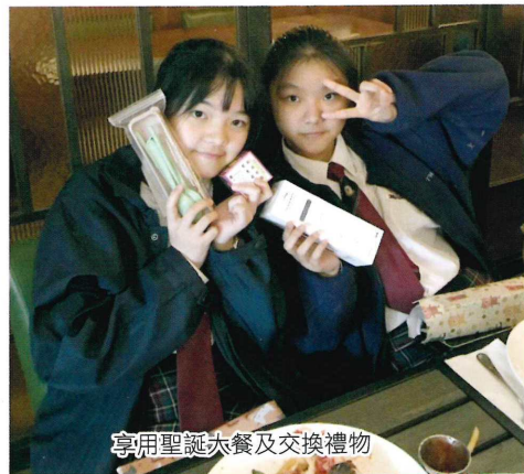
享用聖誕大餐及交換禮物