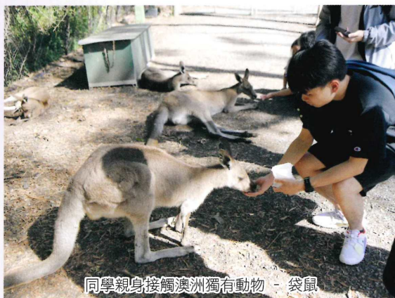
同學親身接觸澳洲獨有動物 - 袋鼠