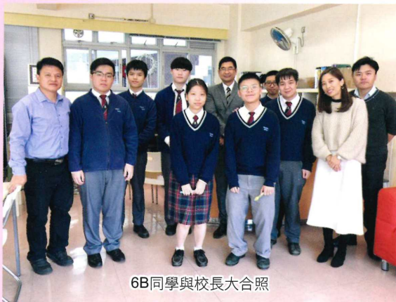
6B同學與校長大合照

為了與鼓勵中六級同學應付公開試及了解同學的需要，校長邀請了中六同學進行午膳聚會。活動以小組形式進行，同學們自行組合與校長午餐。席間氣氛融洽，同學們與校長分享生活的趣事，以及表達他們對學校的期望。每次聚會校長也準備了一份小禮物給同學，以表示對同學們的鼓勵和支持。