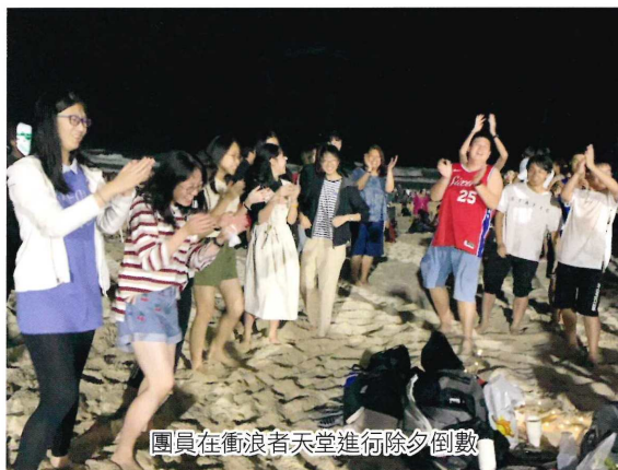
團員在衝浪者天堂進行除夕倒數