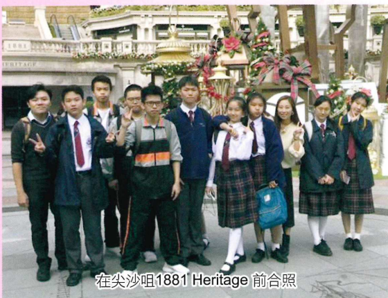
在尖沙咀1881 Heritage 前合照

為協助新來港的同學適應香港及校園生活，本校與東華三院賽馬會沙田綜合服務中心合作，為同學籌劃了為期一年的適應計劃 - 「啟航之旅」。在聖誕節前夕，更安排同學到尖沙咀等本港景點作參觀及遊覽，擴闊同學的眼界。最後，同學們更一同享用了豐富的聖誕午餐，並進行交換聖誕禮物的活動，增加同學對學校的歸屬感。