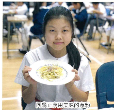
同學正享用美味的意粉

為幫助中一級新生建立對學校的歸屬感，以及提升他們的在課堂上的學習效能，本組於學期初舉行了兩次的「天地宴活動」。中一級同學們於午飯時間，與班主任一同到禮堂進餐。當中的食品包括西餐到會、美式美食及營養膳食等。在用餐前，亦邀請到德育及公民教育組老師，與學生分享「餐桌禮儀」及「珍惜食物」的重要性，從而建立同學正確的價值觀。