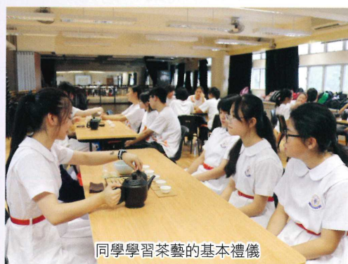
同學學習茶藝的基本禮儀