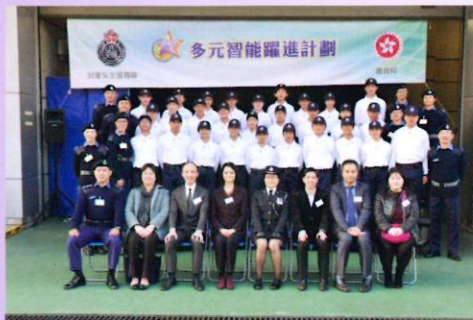
多元智能躍進計劃畢業禮合照

本校28位中二級學生於2017年12月4日參加由教育局及民安隊合辦的5日4夜多元智能挑戰營，透過一連串的紀律和體能活動、領導才能訓練和講座，讓學生從經驗中學習，培養同學成為自律、自信、合群和具抗逆力的年青人，並將所學習的成果應用在日常生活中。