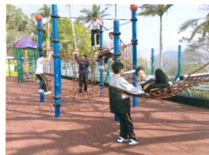
同學正使用營地的設施