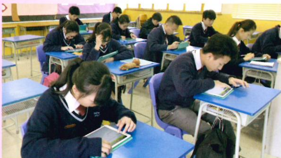
同學正進行基本法問答比賽

2018年3月，中一至中三級同學參加由教育局主辦的「基本法問答比賽」，使同學認識《中華人民共和國香港特別行政區基本法》的條文和理念，了解其地位和解釋《基本法》的機制。