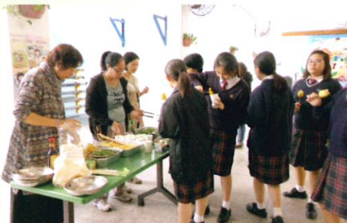
同學們品嚐辛勞耕作的成果

環保大使收割收成，家長為學生洗菜、煮菜，讓全校師生有機會品嚐即摘即食有機菜。是此活動一方面能鼓勵學生多吃素食，又能讓師生、家長彼此分享、交流。