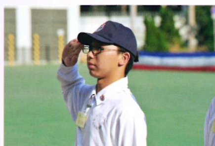
多元智能躍進計劃畢業禮儀式