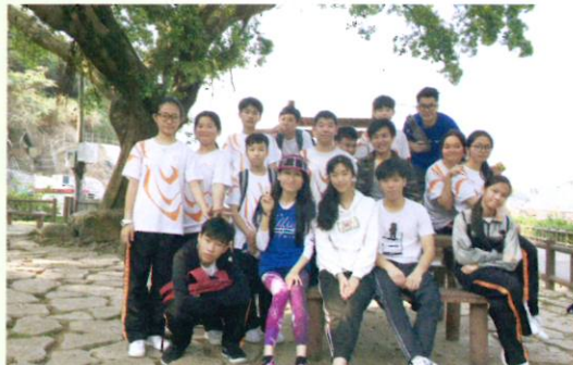
到達黃石碼頭終點，過程中激發學生們的幹勁和鬥志