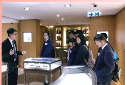
同學們參觀中環鐘錶零售店舖

本校同學於2017年1月27日參與香港鐘錶業總會「帶你進入鐘錶業 - 職業路向工作坊」活動，由鐘錶設計師及市場推廣策劃主管分享入行經驗以及鐘錶業的工作前景，然後前往參觀中環鐘錶零售店舖，了解行業實際運作，為未來作出準備。