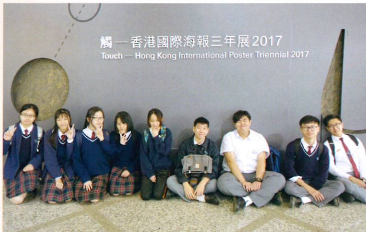
視藝科同學參觀海報展，作全方位藝術學習