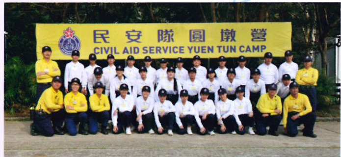
全體中二同學與民安隊導師合照