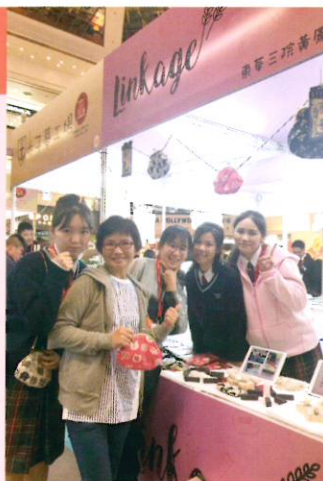
成功銷售後，同學與顧客合照

本校12位來自中三、中四及中五級的同學於2018年1月19至21日參加假鑽石山荷里活廣場「趁墟做老闆」的展銷會活動，親嚐作老闆的滋味，吸收實際營商經驗。同學學習撰寫商業計劃、招聘團隊隊員、預備營商匯報、監控產品質素、計算產品價格、參與銷售工作、策劃宣傳活動及設計攤位佈置等商業知識和技能，奠定了日後營商的基石。