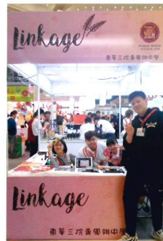
負責趁墟做老闆的同學在櫃枱前留影