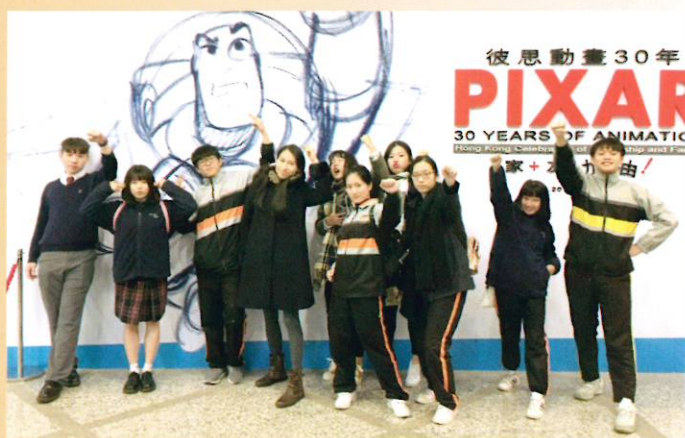
中六選修視藝科同學藉展覽在公開試前夕打氣加油

彼思動畫一直陪伴香港人成長，將原創故事融合藝術與科技，創作出無數風靡全球又感動人的動畫故事。彼思動畫的一系列的電影作品，當中更有宣揚「友情」和「親情」為主題，不時提醒我們人生旅途上的高低起伏，總有朋友和家人為我們「加油」。同學在展覽中欣賞到很多傳統及數碼媒介的創新作品，包括手繪素描稿、彩繪、分鏡圖及雕塑等，一睹彼思動畫歷年來的創作成果，獲益良多。