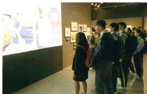
同學們聚精會神欣賞動畫短片