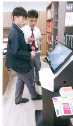
同學正在使用自助借書機