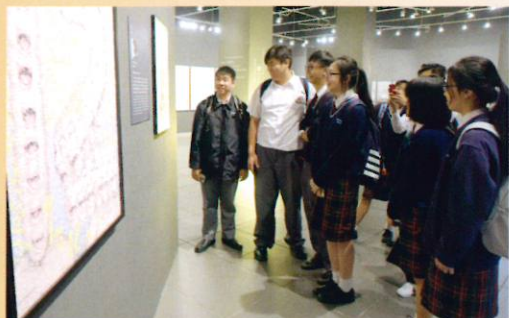
視藝科的同學一同細心觀賞大師的作品

本校於2018年3月22日參觀由康樂及文化事務署與香港設計師協會合辦第六屆「香港國際海報三年展」專題展覽活動，欣賞來自四十個國家及地區共2000多組海報參展作品，從大師及設計師們的海報中一睹豐富多樣的獨特創作面貌及演繹手法，從中擴闊視野。