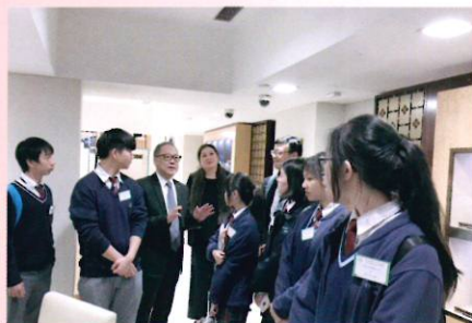
同學細心聆聽嘉賓講解鐘錶業運作