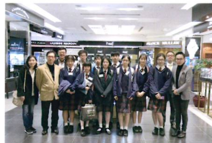
同學與嘉賓一同在鐘錶店舖合照