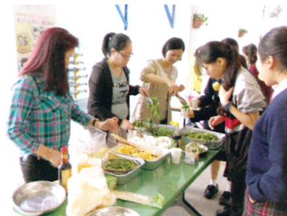
家長們為同學烹調新鮮的有機菜