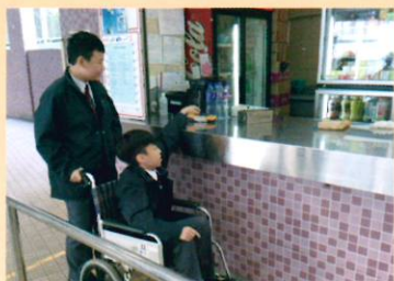
同學以第一身感受，設計更能輔助傷健人士的輪椅

課堂上有一組同學構思重新設計輪椅，同學透過親身試坐輪椅遊走校園，以第一身感受傷健人士的不便，更寫滿了一頁紙的反思，例如「要抬頭跟人說話，脖子會很累」、「心裡覺得低人一級，怕被人嘲笑和歧視」、「買東西很不方便，要別人遷就，心裡會覺得很自卑」等。發覺同學的親身體驗比傳統口頭教授的體會更深，同學們學懂了同理心，能理解別人的感受。