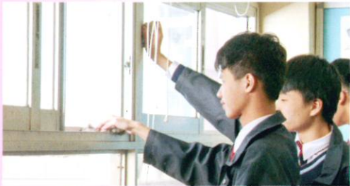
同學正在洗沫課室窗戶

全民清潔日於2018年1月12日舉行，全校學生合力清潔課室，藉以培養同學自律意識。同學們克盡義務清潔課室，營造整潔舒適的學習環境。