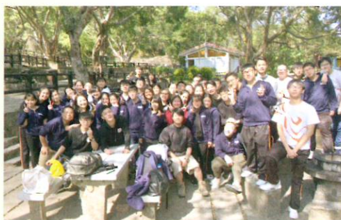
中六級旅行日團體照

而高中同學則前往燒烤場旅行，地點分別為大尾督燒烤場(中四級)、大棠燒烤場(中五級)、鶴藪燒烤場(中六級)；師生談談笑笑，同享歡樂氣氛。