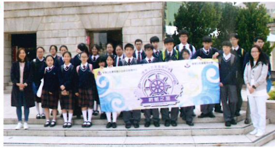
老師及同學在赤柱考察後，在古跡「美利樓」前拍照留念

為協助新來港的同學適應香港及校園生活，本校與東華三院賽馬會沙田綜合服務中心合作，為同學籌劃了一年期的適應計劃-「啟航之旅」。過去曾安排同學到尖沙咀、赤柱等本港景點作參觀及遊覽，擴闊同學的眼界。