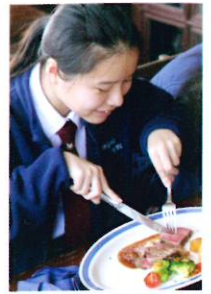
同學正享用一頓豐富的西式午餐，以感受香港的中西文化結合