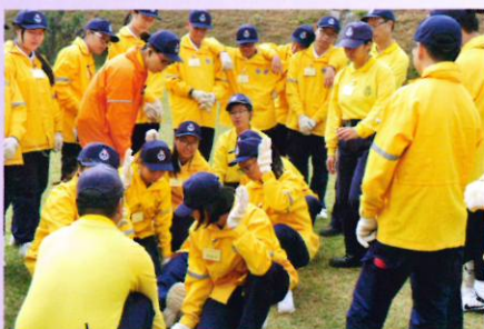
同學正進行模擬救援工作