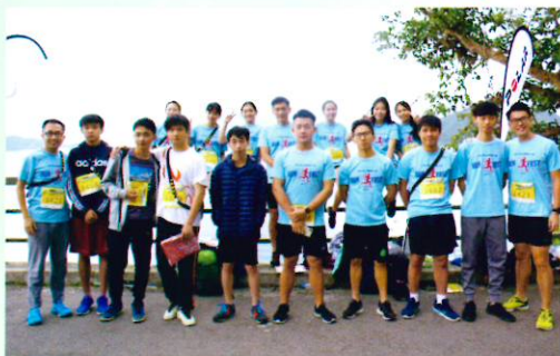
共6隊師生參與半馬接力賽，人強馬壯！