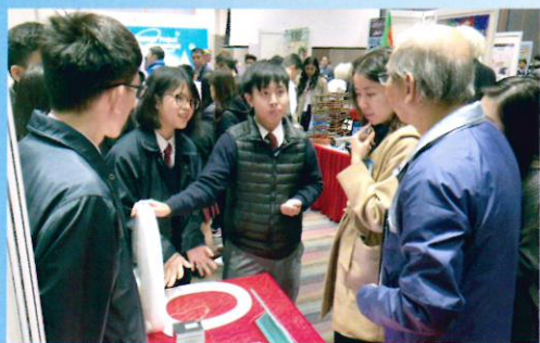
同學向來賓介紹自潔馬桶蓋原理

參賽當日，經過匯報和問答環節後，他們的作品獲得評判團的肯定，從本年度90所中學近300支隊伍中脫穎而出，於高中組發明品組別晉身最後六強，並於四月份與聖保羅男女中學、聖公會林護紀念中學等五所中學對壘，爭奪冠軍寶座。