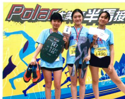
三名女將勇奪組別亞軍