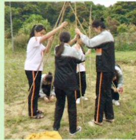
學生正在同心合力，用竹枝扎起帳篷

學生的情緒健康近年受到家長及社會的關注，本校特為中一及中二級的同學，舉辦了全年的正向教育活動-「逆風行」。意旨透過成長小組、歷奇活動等方式，加強同學的抗逆能力，並建立正面的價值觀念。