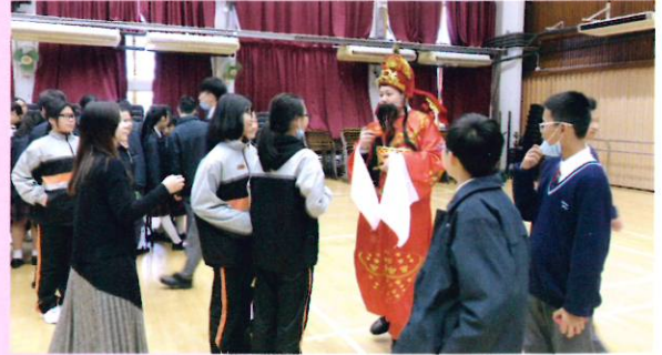
同學生動地扮演財神，增添活動的氣氛

本組與中文科於2018年2月9日合辦慶祝農曆新年活動，全校師生在禮堂進行慶祝活動，由同學扮演財神，同時安排了傳統節日食品供同學享用，喜氣洋洋。