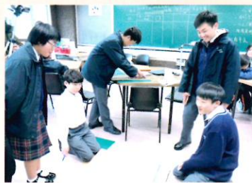
同學動手製作，從中學學習設計物件的原理

另外有些喜愛做中學(Learning by doing)，不喜歡傳統課堂講授。老師為此減少課堂講授時間，並將10分鐘的簡介縮短為3分鐘，盡量給予同學有足夠空間構思原型。