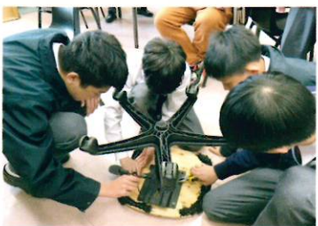
組員合力重新設計椅子

還有一組同學要重新設計椅子，他們二話不說地就動手做起來，先拆掉舊椅子，再與組員討論新的椅子設計，並運用了在創客空間學到的3D設計軟件Tinkercad，製作了3D設計圖。同學們在過程中進入了心流(Flow)狀態，並且實踐了自學精神，於網上搜索椅子的尺寸和三角形的比例等資料。