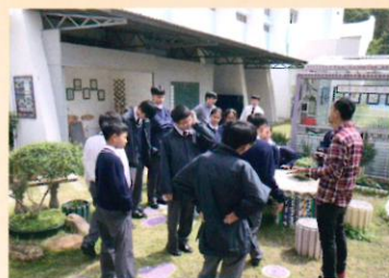
老師提供框架和指引，重新為本校環保徑添加新元素

有些同學不喜愛思考和動手做，喜歡跟從老師指示，設計教學目標時需要提升同學學習動機，老師附以一些框架和指引，降低課程的難度。他們要重新設計學校的環保徑，同學構思加入音樂和藝術的元素，因此他們學習製作夏威夷小結他，為環保徑增添藝術色彩。