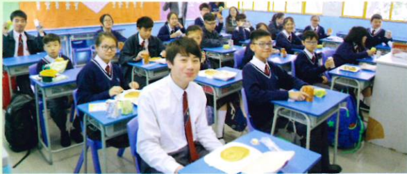
1A班同學獲得初中組冠軍，正享用麥當勞的早晨全餐

為加強同學的紀律和公德心，輔導組與訓導組合辦「勤學與課室清潔比賽」。比賽期間，因應同學的準時出席率及維持班房的整潔程度，評審老師將會為全校班別評分。分數最高的初中及高中三級，將獲得一頓豐富的早餐，與班主任及同學一起享用。