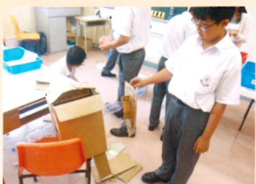
同學正以紙皮製作機械人

另外，課程當中有一節課是設計心儀的玩具，當同學製作紙皮機械人時，發揮了自己的創意和專有技能，在有限的物資中，竟然造出了入樁的技巧。此外，平日沉默寡言的同學，也在課堂中發現到他們的專長，有些同學繪畫精美，也有些同學略懂韓文。