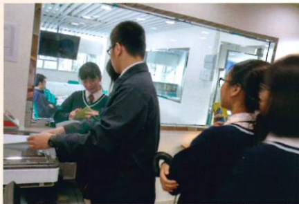
圖書館學會幹事向同學介紹影印機的複印及列印服務

經過為期約6個月的裝修後，圖書館於2018年2月正式重新投入服務。同時圖書館在翻新後添置以下設施及服務，包括桌上電腦及平板電腦借用服務，影印機複印、列印及掃描服務，自助借書機及會議室借用服務，以供同學使用。在2018年3月23日舉行圖書館設施使用簡介會，藉以令同學認識如何使用圖書館設施，增加學習效能。