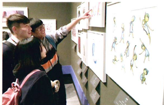
同學們細看畫作，學習不同的藝術