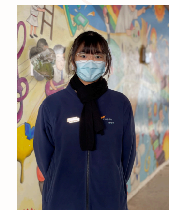
我希望成為一個知書識禮的好學生