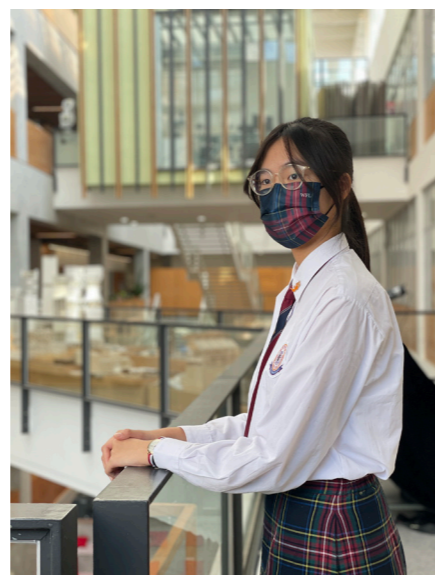
我希望用自己的興趣和能力去祝福別人