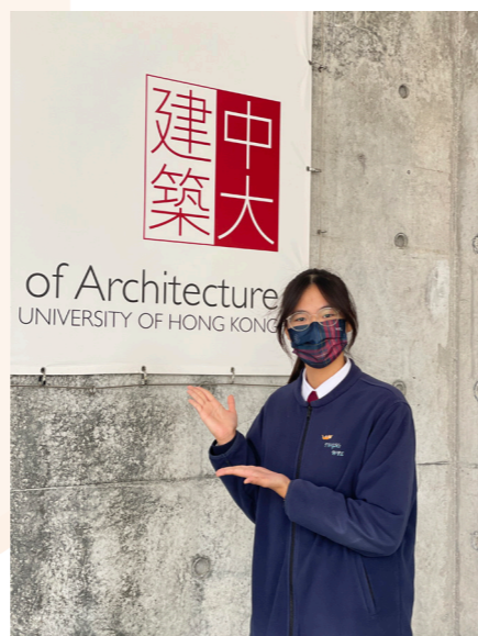
成為建築師是我的一生的夢想

最後，育莉深信：「在黃鳳翎，人人都可以找到真正的自己，發光發亮！每個人可以找到自己的舞台，表現自己最精彩的演出！」