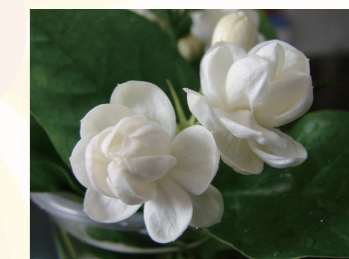
茉莉花帶有淡雅、恬靜的特質