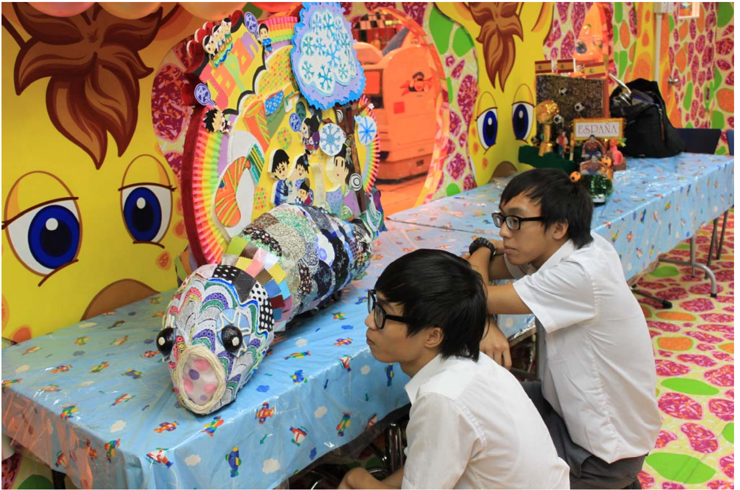
本校同學獲經濟日報及 Take Me Home 地區報邀請接受訪問過程