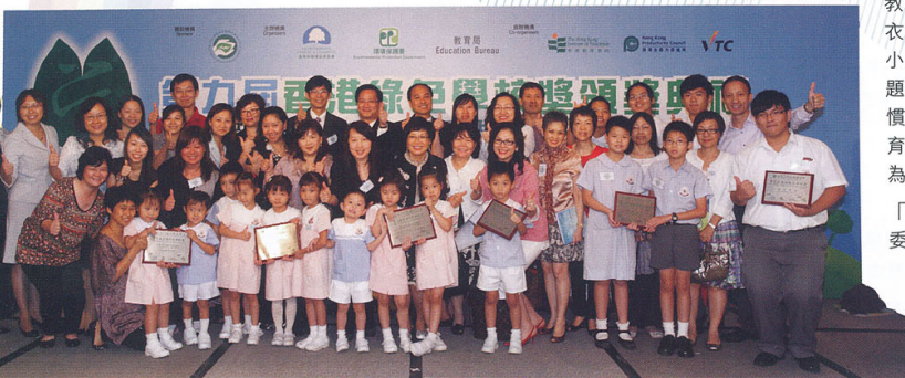
東華轄下多間學校獲獎，陣容鼎盛，攝於「香港綠色學校獎」頒獎禮上。

廖恩德紀念幼稚園 高德根紀念幼稚園 洪王家琪幼稚園 呂馮鳳紀念幼稚園 李黃慶祥紀念幼稚園 黎鄧潤球幼稚園 徐展堂幼稚園 方樹福堂幼稚園 黃朱惠芬幼稚園 黃士心幼稚園 田灣幼稚園 香港華都獅子會幼稚園